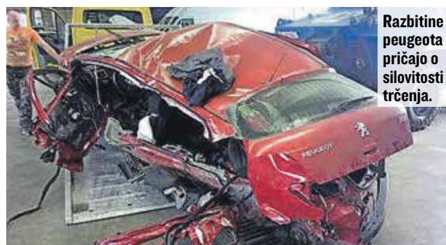
Razbitine peugeota pričajo o silovitosti trčenja.

na poti skozi Komendo proti Mostam pripeljal iz desnega nepreglednega ovinka v levi ovinek in domnevno zaradi neprilagojene hitrosti izgubil nadzor nad vozilom. Zapeljal je na bankino, pri čemer se je vozilo obrnilo in trčilo v betonsko ograjo ter se odbilo na vozišču. Med trčenjem v ograjo sta voznik in eden od sopotnikov padla iz vozila ter obležala na vozišču.«