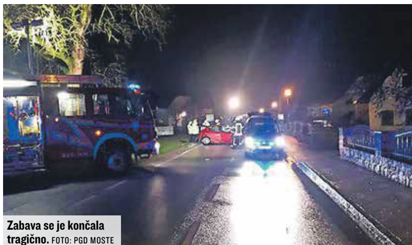
Zabava se je končala tragično.

Slavljenec Rok Kern je bil v prometni nesreči takoj mrtev Strti starši že štiri leta čakajo na sojenje vozniku Maticu Ciperletu